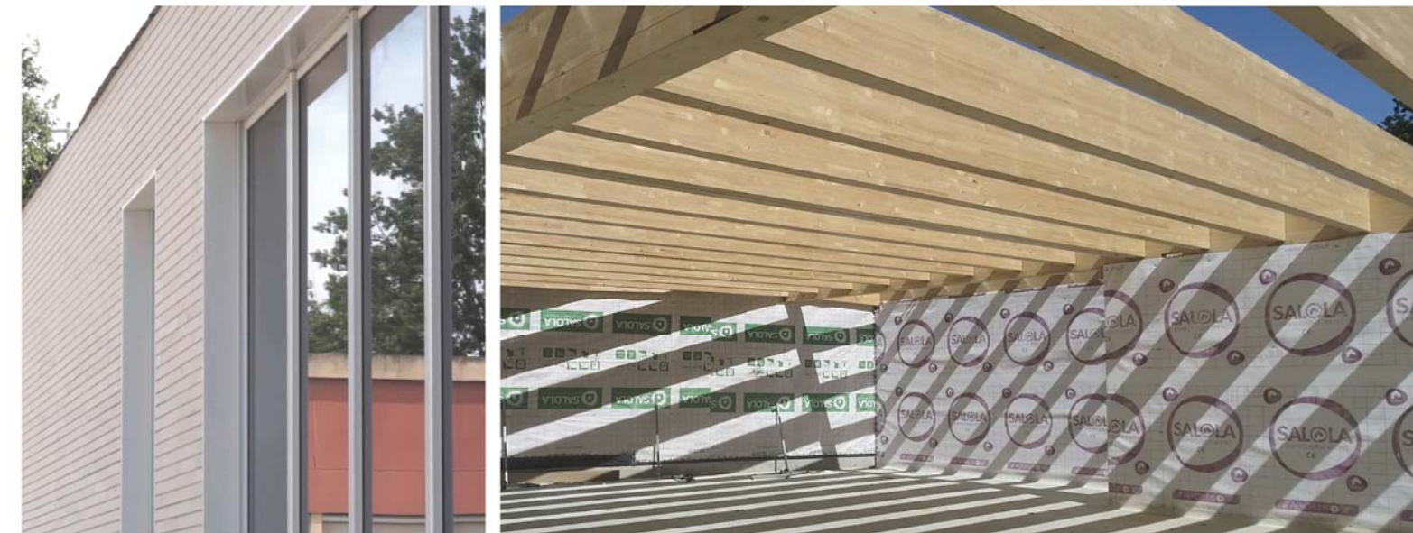
Photographies du chantier en cours