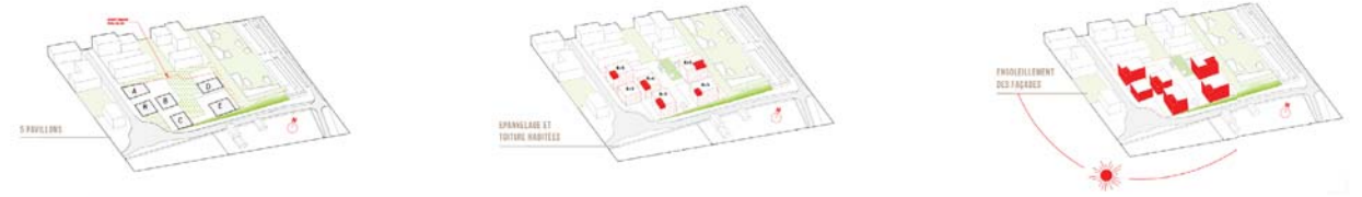
Axonométries des grands principes du projet