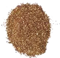
LIMONS 2µM À 60µM