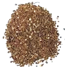
SABLES 60µM À 2MM