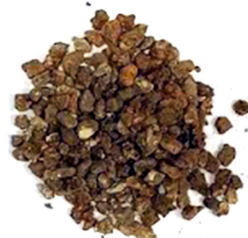
GRAVIERS 2MM À 2CM