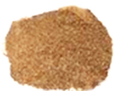
ARGILES < 2µM